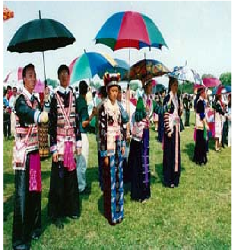
Photo du nouvel an hmong de Green Bay, WI. Elle fût publiée dans l'édition du journal Hmong Times, du 15 septembre 2002.